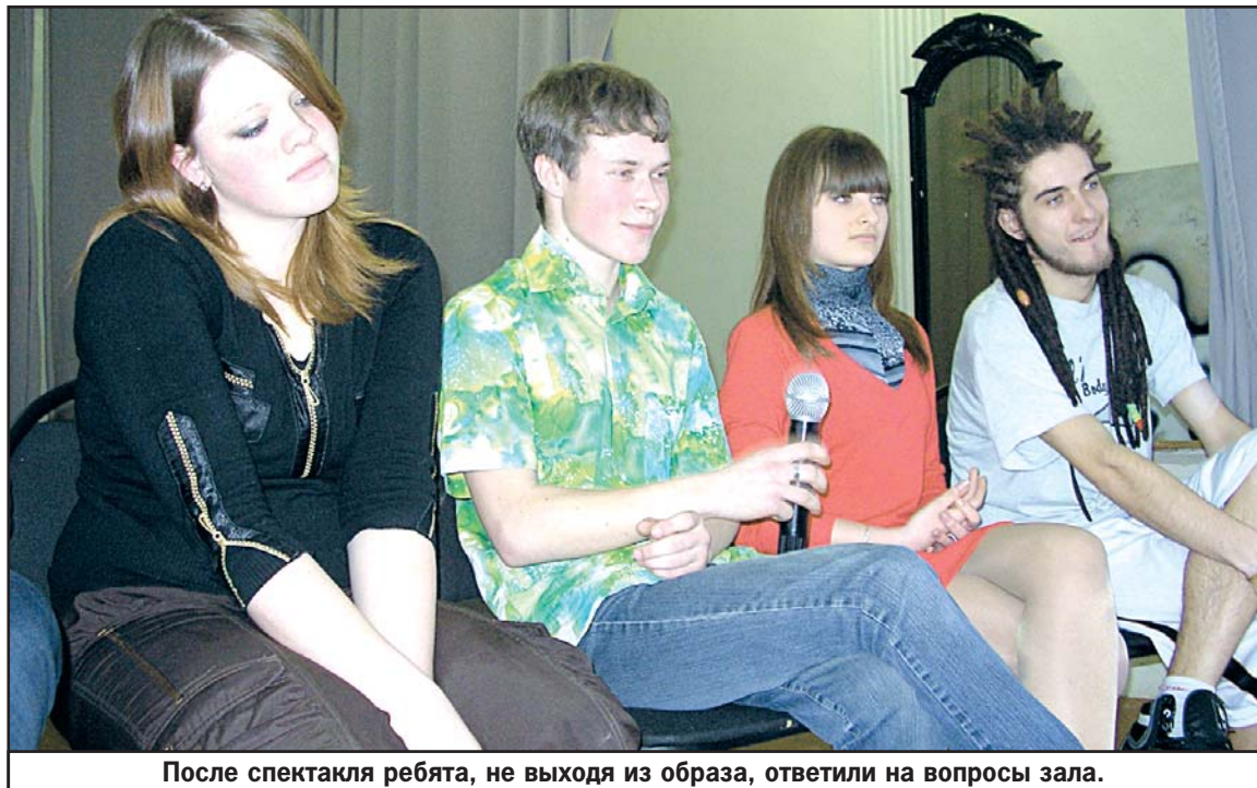
После спектакля ребята, не выходя из образа, ответили на вопросы зала.