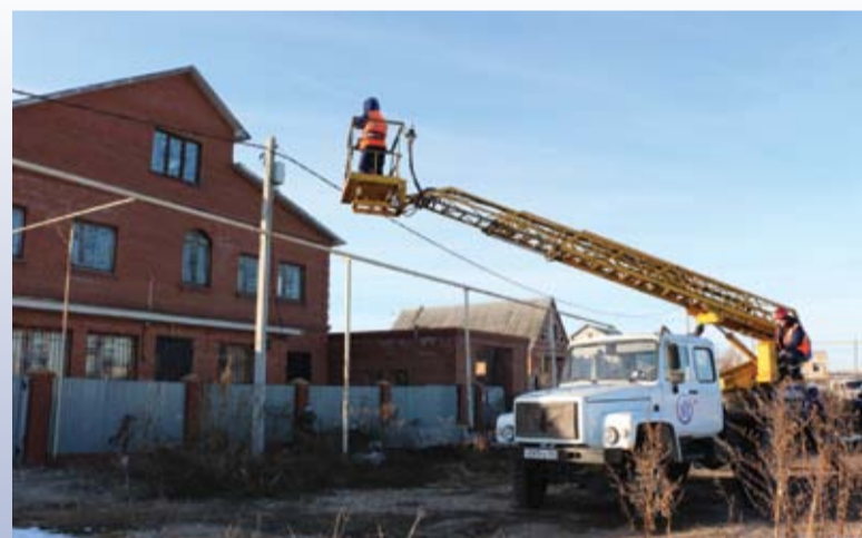
Коттедж местного жителя в с. Переволоки «отрезают» от электросети за самовольную врезку. Также нарушителю будет выставлен счет за бездоговорное потребление электроэнергии.

Весь комплекс мероприятий, в котором принимают участие такие отделы АО «ССК», как служба контроля учета потребляемой электроэнергии, управление правового обеспечения, служба экономической безопасности и отдел по связям с общественностью и работе со СМИ, направлен на улучшение экономической деятельности компании и оптимизацию издержек в рамках антикризисного плана, с чем наши специалисты успешно справляются и только улучшают показатели.