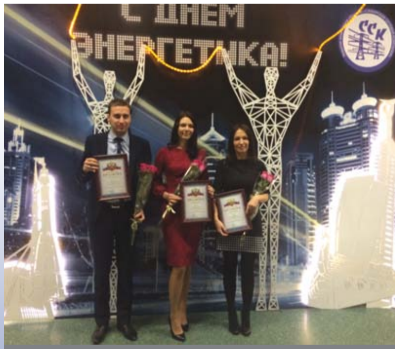
На Дне Энергетики, 23 декабря в КРЦ «Звезда» победителям конкурса «Лучший сотрудник Центра обслуживания потребителей» были вручены Дипломы и подарки от руководства АО «ССК».

В финальный отборочный тур прошли 32 рисунка. Результаты конкурса будут подведены в конце декабря. Победители и участники конкурса получат подарки от АО «ССК». Об итогах конкурса и награждении победителей вы узнаете в следующем выпуске газеты «Энергия без границ». Все работы участников вы можете увидеть на нашем сайте в разделе «Фото и видеоархив».