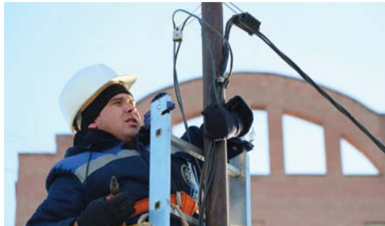
Электромонтеры ССК обесточивают собственника торговой точки на местном рынке в Сызрани за бездоговорное потребление электроэнергии.

Например, в Сызрани за задолженность был выявлен потребитель, фактические объемы потребляемой электроэнергии которого составили порядка 4000 кВтч в месяц – по оценке специалистов компании, в среднем это сопоставимо с потреблением примерно восьми трехкомнатных квартир. Помимо физических лиц, регулярно проверяются и юридические, особенно часто – индивидуальные предприниматели, во владении которых небольшие киоски. С целью экономии предприниматели не заключают договоров на поставку электроэнергии, но активно ее потребляют. Суммы, которые выставляются