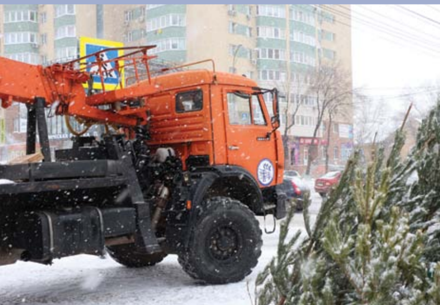
На объект для отключения потребителя от сети вызывается современная спецтехника – автогидроподъемник и ремонтная бригада электромонтеров.

Так, в Тольятти в декабре сотрудниками управления правового обеспечения совместно с сотрудниками отдела экономической безопасности и судебными приставами ОСП Комсомольского района г. Тольятти УФССП России по Самарской области был совершен совместный выезд к Хубежову Славе Робертовичу, который,