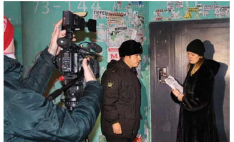
Сотрудники управления правового обеспечения на совместном рейде с приставами Самарской области пытаются попасть к неплательщику за электроэнергию, чтобы вручить исполнительный лист.

➤ За 11 месяцев 2016 года по Самарской области специалисты АО «ССК» выявили 265 фактов воровства электроэнергии. Из них были выявлены 145 фактов незаконного потребления электроэнергии без договора с гарантирующим поставщиком объемом на 3620 МВтч, что составляет 20,4 млн рублей