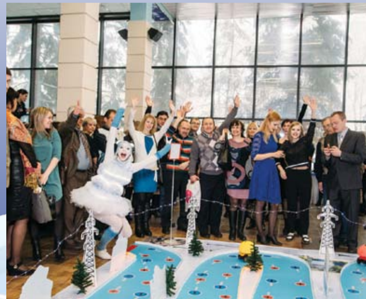
На празднике гости развлекали себя интерактивной игрой – путешествием по истории энергетики Самарской области: от первых исторических объектов, подключенных к электричеству, до современного «города будущего».

После театрального представления гости получили заряд положительных эмоций, смеха и веселого настроения, а также подарки от «Самарской сетевой компании».