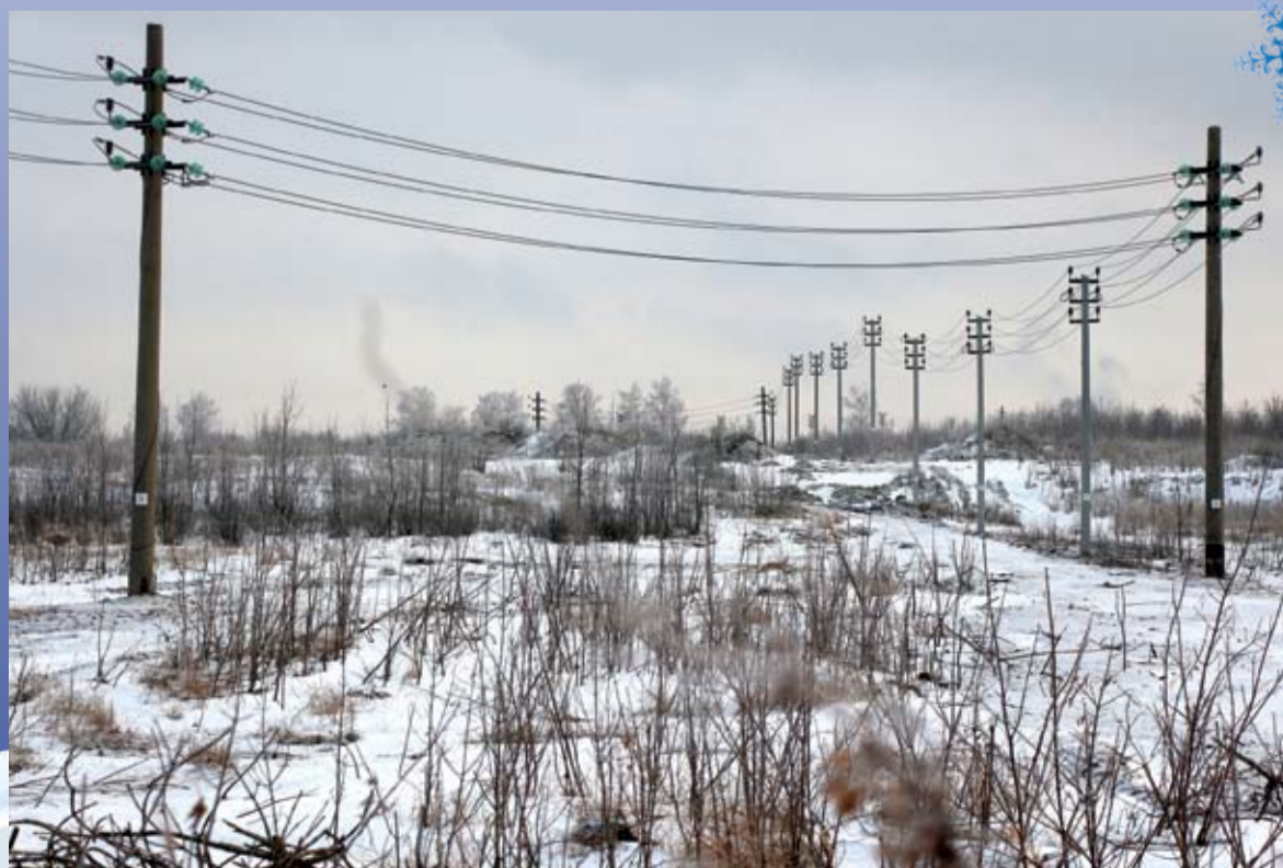
Общая мощность, подаваемая на объекты инфраструктуры, составит около 34 МВт, а протяженность распределительных сетей, которые будут построены к 2018 году, – почти 200 км.

После окончания брифинга журналистам была предоставлена возможность побывать на месте возведения Стадиона «Самара-Арена» и объектов инфраструктуры Чемпионата и оценить проделанный энергетиками масштаб работ по строительству электросетей.